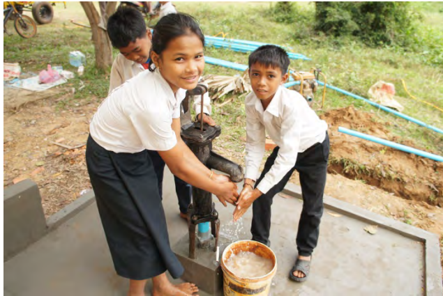
小型ポンプ式井戸